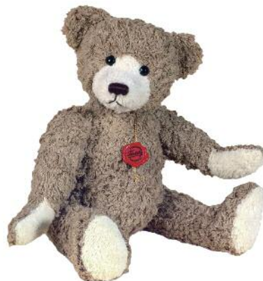
Drück mich! sagt der nostalgische Kuschelbär von TEDDY HERMANN .