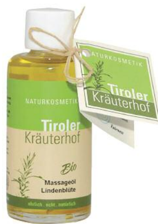
Entspannend wirkt das Massageöl Lindenblüte von TIROLER KRÄUTERHOF.