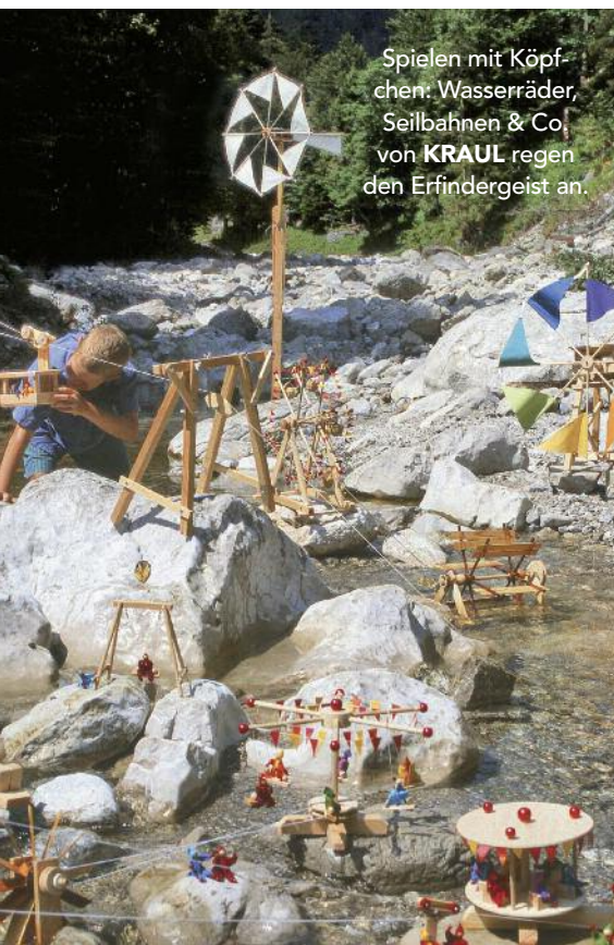
Spielen mit Köpfchen: Wasserräder, Seilbahnen & Co. von KRAUL regen den Erfindergeist an.

50. Naseweiss ist ein Projekt der Ostalb-Werkstätten des Samariterstifts Neresheim. Hier werden pfiffige Holzspielzeuge für Kinder ab 6 Jahren gefertigt. PRODUKTE AUS DER HEIMAT: Ein vielfältiges Sortiment an Holzspielwaren INFO: Samariterstiftung Neresheim, Ostalb-Werkstätten, Karl-Bonhoeffer-Straße 2, D-73450 Neresheim, Tel. 0 73 62-96 32 21, www.naseweiss-spiele.de