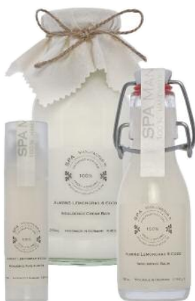
Alles Gute für die Haut: die „Indulgente Line“ von SPA MANUFACTUR.

32. Weleda Vom Feld direkt in die Tube – der 20 Hektar große Heilpflanzengarten, nahe des Firmensitzes Schwäbisch Gmünd, liefert die Rohstoffe für die Herstellung der Naturkosmetik. PRODUKTE AUS DER HEIMAT: Eine große Produktpalette in den Bereichen Naturkosmetik und Arzneimittel INFO: Möhlerstraße 3, D-73525 Schwäbisch Gmünd, www.weleda.de