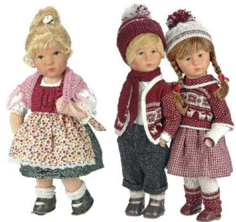
Sie waren schon Omas treue Spielgefährten: die Puppen von KÄTHE KRUSE .