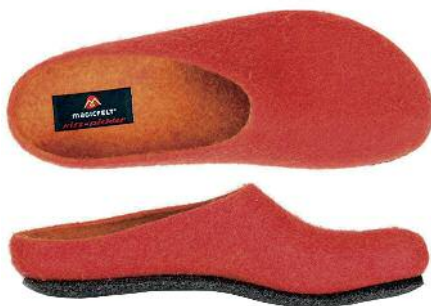
Mit den weichen Schlappen von GOTTSTEIN kriegen Sie keine kalten Füße.

PRODUKTE AUS DER HEIMAT: Bettwäsche, Kissen, Turnbeutel, Taschen, Baumwollstoffe, Wäscheköpfe und mehr INFO: Sendlingerstraße 47, D-80331 München, Tel. 0 89-18 91 00 38, www.lavendels.de