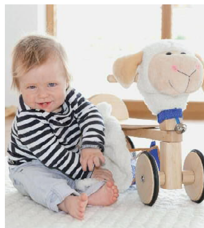
Für Kinder bestens geeignet: Die handgewebten Teppiche von SIMSSEE bestehen aus schadstoffgeprüfter Schafwolle.

PRODUKTE AUS DER HEIMAT: Fleckerlteppiche und Schafwollteppiche INFO: Hofgartenstraße 9, D-83071 Waldering, Stephanskirchen, Tel. 0 80 36-21 89, www.lichtteppich.de