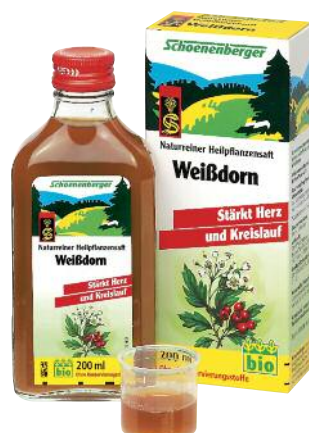
Wohltuend für Herz und Kreislauf: der Pflanzensaft von SCHOENENBERGER.