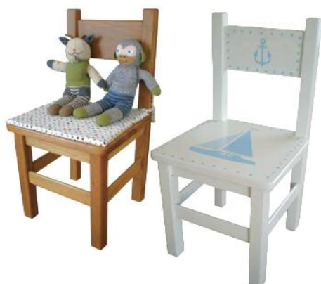
Echte Unikate: Die Kindermöbel von PIPPIKAKKA sind von Hand bemalt.

PRODUKTE AUS DER HEIMAT: Möbel für Outdoor und Indoor