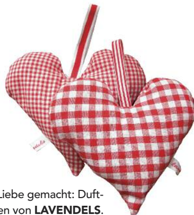
Mit Liebe gemacht: Duft-herzen von LAVENDELS .

PRODUKTE AUS DER HEIMAT: Freizeitbekleidung und Patschen, Hüttenschuhe und Stoffe INFO: Bundesstr. 1, A-6460 Imst, Tel. 00 43-(0) 54 12-66 25 10, www.gottstein.at