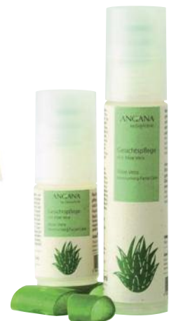
Gesichtspflege mit Aloe Vera-Frischpflanzensaft von GRÜNE ERDE.