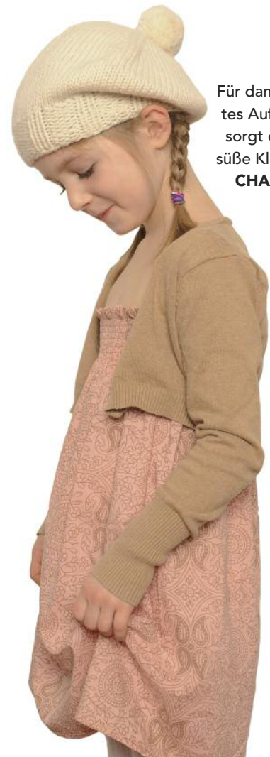
Für damenhaftes Auftreten sorgt dieses süße Kleid von CHARLE .

PRODUKTE AUS DER HEIMAT: Krabbelpuschen und Schuhe INFO: Flurweg 8, D-21244 Buchholz, Tel. 0 41 81-94 23 23, www.prinzundprinzessin.eu