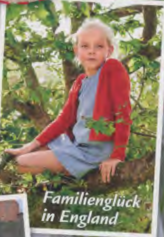
Familienglück in England