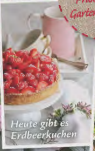
Heute gibt es Erdbeerkuchen

3/2018 · Deutschland 3 Frankreich 4,40 € · Österreich 4 Schweiz 7,00 sfr · Benelux 4 Italien 4,40 € · Slowakei 5