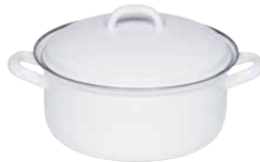
Kasserolle mit Deckel Casserole with lid ø 12, 0126-033 ø 14, 0127-033 ø 16, 0128-033 ø 18, 0129-033 ø 20, 0130-033 ø 22, 0131-033