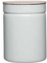
Vorratsdose Maxi ø 13 Box