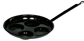
Augenpfanne Pan for 4 eggs 0294-022