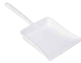
Staubschaufel Dust scoop 0362-033 ohne Gummilippe