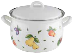
Fleischtopf mit Deckel Sauce pot with lid ø 16, 0164-068 ø 18, 0165-068 ø 20, 0166-068