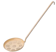
Backschaufel Baking scoop