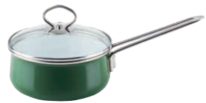
Stielkasserolle mit Glasdeckel

ø 16, 0707-013 ø 20, 0709-013 ø 24, 0711-013