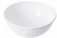
Obst- und Salatschüssel Bowl ø 22, 0464-033 ø 26, 0465-033 ø 30, 0438-033