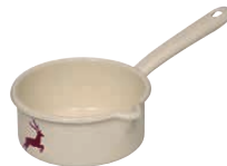
Stielkasserolle Sauce pan ø 14, 0036-071