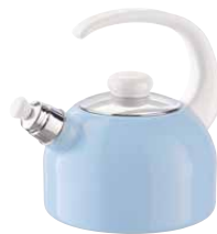
Flötenkessel Water kettle with whistle