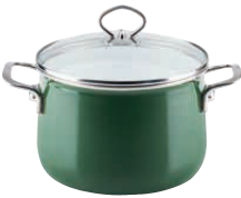
Fleischtopf mit Glasdeckel

The new Verde shade, reminding us of a moss-covered forest floor. A leading product with an extra strong, heat-storing steel base and glass lid.