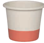
Muffinform Muffin cup ø 8, 0674-570