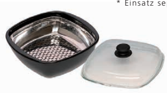
Dampfgarer 3-tlg. mit Glasdeckel und Gareinsatz Steam cooker 3 pcs with glass lid 28x28, 0114-022 28x28, 0699-108*