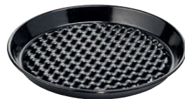
Grilltasse rund, Boden gelocht Cup barbecue round with holes ø 32, 0400-022