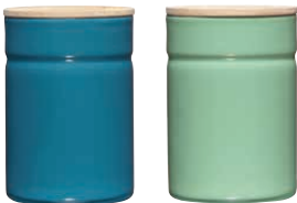
Vorratsdose ø 8 Box