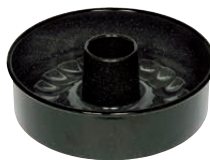
Tortenform 3-tlg. Cake form round 3 pcs ø 26, 0485-022