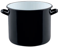
RIESEN Topf mit Bördel GIANT Pot

As carry strap and for fixing the lid we have the GIANT PAN CARRIER made of finest calf leather.