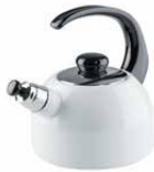
Wasserkessel mit Flöte Water kettle with whistle 2 l, 0543-033