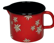
Schnabeltopf rot Jug red ø 12, 0040-080