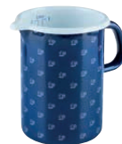
Küchenmaß Measuring vessel 1 l, dirndlblau, 0338-074

ø 12, pünktchenblau, 0035-075 ø 16, dirndlblau, 0037-074