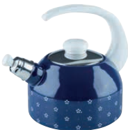
Wasserkessel mit Flöte Water kettle with whistle

Rectangular baking dish 33x20, dirndlblau, 0046-074