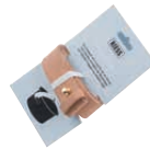
RIESENTRÄGER Tragegurt Leder Giant pot carrier 115 cm, 4954-000

ø 12, 0252-017 ø 14, 0253-017 ø 16, 0254-017 ø 18, 0255-017 ø 20, 0256-017 ø 24, 0258-017 ø 28, 0260-017 ø 32, 0262-017