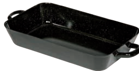
Bratpfanne Rectangular baking dish 26x17, 0049-022 29x18, 0045-022 33x20, 0046-022 37x22, 0047-022