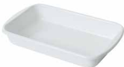
Auflaufform Rectangular baking dish 36x21,50, 0435-033