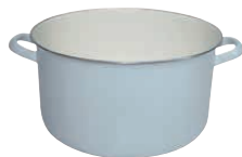
Einsiedekasserolle, extrastarker Boden Casserole to boil down ø 28, 0162-006