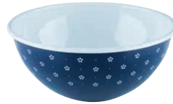
Obst- und Salatschüssel Fruit/salad bowl

ø 22, dirndlblau, 0464-074 ø 26, blümchenblau, 0465-073