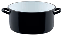
RIESEN halbhoch Kasserolle mit Bördel GIANT Casserole

4 l, ø 20, 0228-017 8 l, ø 24, 0230-017 12 l, ø 28, 0232-017 20 l, ø 32, 0234-017