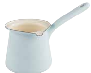
Kaffeekocher Coffee maker