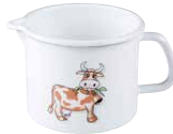
Schnabeltopf Jug ø 10, 0039-084 ø 12, 0040-084 ø 14, 0041-084