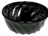
Guglhupfform Ring cake form ø 18, 0631-022 ø 22, 0495-022 ø 24, 0632-022