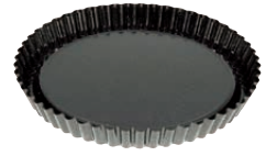
Obsttortenboden Flan form round ø 30, 0868-022