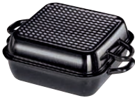
Bratpfanne mit Deckel Baking pan with lid 26x26, 0110-022