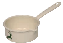
Stielkasserolle Sauce pan ø 14, 0036-072