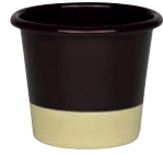
Muffinform Muffin cup ø 8, 0674-573