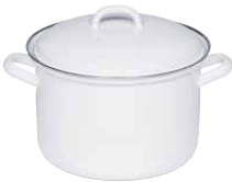
Fleischtopf mit Deckel Sauce pot with lid ø 14, 0121-033 ø 16, 0122-033 ø 18, 0123-033 ø 20, 0124-033 ø 22, 0125-033