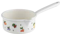
Stielkasserolle mit großem Ausguss Sauce pan with spout ø 14, 0036-068