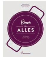
Kochbuch Einer für ALLES Cookbook (german) 1962-000