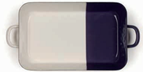
Back- und Bratform Rectangular baking dish 33x20, 0046-571