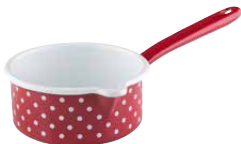
Stielkasserolle mit großem Ausguss Sauce pan with spout ø 14, 0036-077