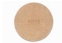
Topflappen Pot holder 4951-000