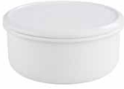
Brot/Keksdose mit Deckel Bread/Cookie bin ø 24, 0645-033