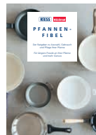
Pfannenfibel (german) Download unter riess.at