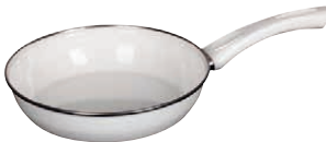
Ceramicglas Pfanne White

Ceramicglas Pan ø 24, 0042-032 ø 28, 0057-032