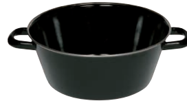
Schmalzpfanne halbtief Lard pan ø 20, 0370-022 ø 24, 0371-022 ø 26, 0372-022 ø 30, 0373-022