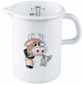
Küchenmaß Measuring vessel 0,5 l, 0337-084 1 l, 0338-084

These milk pans and cans are adorned with mooing alpine cows.