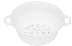
Gemüsesieb Sieve for vegetables ø 26, 0328-033