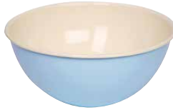
Obst- und Salatschüssel Fruit/salad bowl