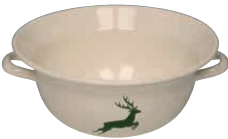
Weitling Bowl with 2 handles ø 28, 0296-072