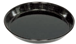
Pizzablech Pizza tin ø 28, 0648-022 ø 32, 0649-022