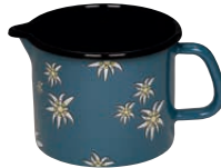
Schnabeltopf blau Jug blue ø 14, 0041-081