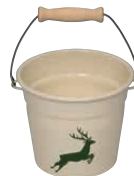
Minieimer Mini-bucket 1,75 l, 0597-072