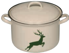
Fleischtopf mit Deckel Sauce pot with lid ø 16, 0122-072 ø 22, 0125-072