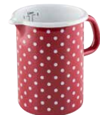
Küchenmaß Measuring vessel 0,5 l, 0337-077 1 l, 0338-077