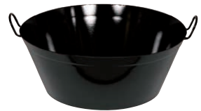
Schmalzpfanne tief Lard pan ø 45, 0375-022