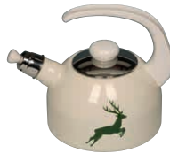
Wasserkessel mit Flöte Water kettle with whistle 2 l, 0543-072