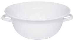
Weitling Bowl with 2 handles ø 28, 0296-033