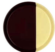
Kuchenblech Baking tray ø 32, 0649-573