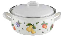
Kasserolle mit Deckel Casserole with lid ø 16, 0169-068 ø 18, 0170-068 ø 20, 0171-068