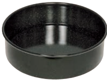
Tortenform Cake form ø 20, 0480-022 ø 24, 0493-022 ø 26, 0494-022 ø 28, 0498-022