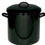
Vorratstopf mit Deckel Stock pot with lid ø 30, 0352-006