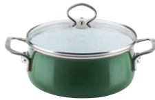
Kasserolle mit Glasdeckel

ø 16, 0701-013 ø 20, 0703-013 ø 24, 0705-013