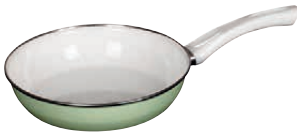
Ceramicglas Pfanne Green

Colours bring cheerfulness into the kitchen and to cooking. Our ceramicglass pans, with a fresh look and made from porcelain enamel that is natural through and through.