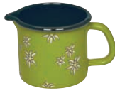
Schnabeltopf grün Jug green ø 10, 0039-085

Let beautiful, alpine edelweiss flowers remind you of wonderful summer hikes, even when you're warming milk at home.