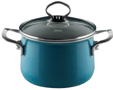
Fleischtopf mit Glasdeckel

Top-quality products in stylish aquamarine – for those for whom classy colours, modern shapes and a high level of functionality are important. With an extra heat-storing steel base and glass lid.