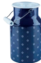
Milchkanne mit Deckel Milk can with lid