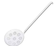
Backschaufel Baking scoop ø 12, 0542-033