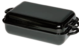
Bratpfanne mit Deckel Rectangular baking dish with lid 32x22, 0104-022 37x26, 0105-022