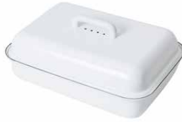
Brotdose mit Deckel Bread bin 37x26, 0616-033