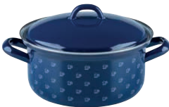
Kasserolle mit Deckel Casserole with lid

ø 22, dirndlblau, 0464-074 ø 26, blümchenblau, 0465-073