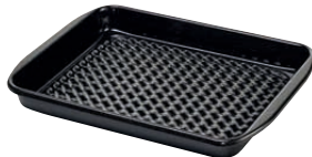
Grilltasse eckig, Boden gelocht Cup barbecue rectangular with holes 32x42, 0399-022