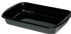
Bratrohrpfanne hoch Baking pan high 32,80x41,60, 0402-022