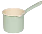
Schnabeltopf mit Stiel