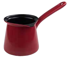
Kaffeekocher Coffee maker