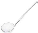
Schöpflöffel Ladle ø 7, 0307-033 ø 8, 0308-033 ø 9, 0309-033