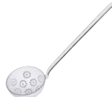
Schaumlöffel Skimmer ø 9, 0310-033