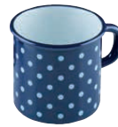
Topf mit Bördel/ Trinkbecher Mug

ø 9, dirndlblau, 0038-074 ø 10, pünktchenblau, 0039-075 ø 12, blümchenblau, 0040-073 ø 14, dirndlblau, 0041-074