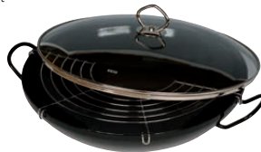
Wok komplett, Stahlglasur Wok compl. ø 36, 0388-022