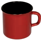
Topf mit Bördel/ Trinkbecher Mug

Pure and bright colours to create different atmospheres. Navy blue, warm red and fresh green.