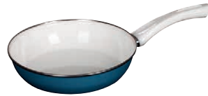
Ceramicglas Pfanne Blue

Ceramicglas Pan ø 24, 0042-031 ø 28, 0057-031