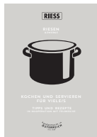
Kochen für Viele/s (german) Download unter riess.at