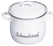
Schmalztopf Lard pan 1,75 l, 0300-033