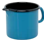
Schnabeltopf / Jug