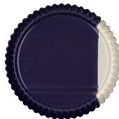
Obsttortenboden Round flan form ø 30, 0868-571