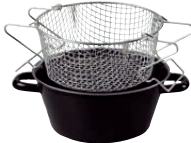
Pommes-frites-Pfanne mit Einsatz Chip pan ø 20, 0366-022 ø 24, 0052-022 ø 26, 0367-022 ø 20, 2736-000* ø 24, 2737-000* ø 26, 2738-000*