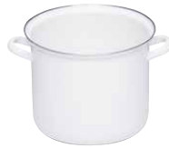
Hoher Topf ohne Deckel Stock pot without lid ø 22, 0274-033