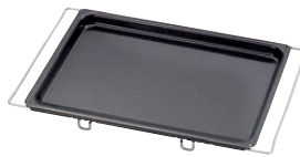
Backblech Multiflex Tray MULTIFLEX 41-51x33, 0403-022