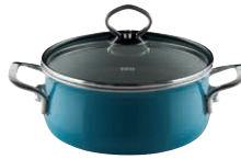
Kasserolle mit Glasdeckel

ø 16, 0701-010 ø 20, 0703-010 ø 24, 0705-010