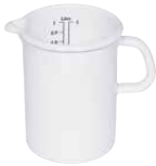
Küchenmaß Measuring vessel 0,5 l, 0337-033 1 l, 0338-033 2 l, 0349-033 3 l, 0350-033