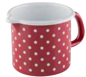
Schnabeltopf Jug ø 9, 0038-077 ø 10, 0039-077 ø 12, 0040-077