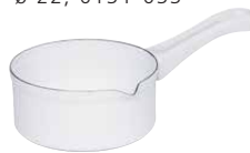
Babystielkasserolle Baby sauce pan ø 14, 0034-033