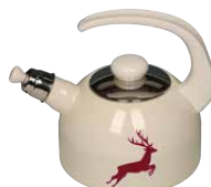
Wasserkessel mit Flöte Water kettle with whistle 2 l, 0543-071