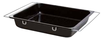
Backblech Multiflex hoch Tray MULTIFLEX high 41-51x33x7, 0408-022