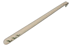
Schuhlöffel Shoehorn 51,50, 0521-072