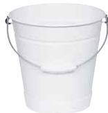
Wassereimer Bucket 10 l, 0360-033