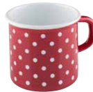
Topf mit Bördel/ Trinkbecher Mug ø 8, 0221-077