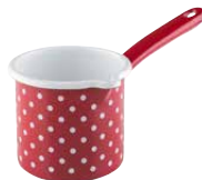
Schnabeltopf mit Stiel Milk pan ø 10, 0284-077