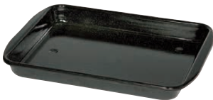
Bratrohrpfanne niedrig Baking pan 32,80x41,60, 0401-022