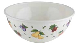
Obst- und Salatschüssel Fruit/salad bowl ø 26, 0465-068