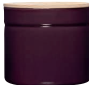
Vorratsdose ø 13 Box