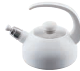
Wasserkessel mit Flöte Water kettle with whistle 1,5 l, 0544-033