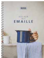
Kochbuch RIESS Emaille Cookbook (german) 1960-000