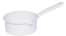
Stielkasserolle mit großem Ausguss Sauce pan with spout ø 12, 0035-033 ø 14, 0036-033