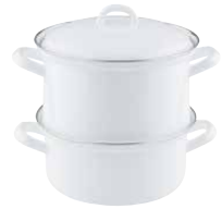
Kartoffelkocher mit Emailledeckel 3 pcs steamer set ø 18, 0286-033